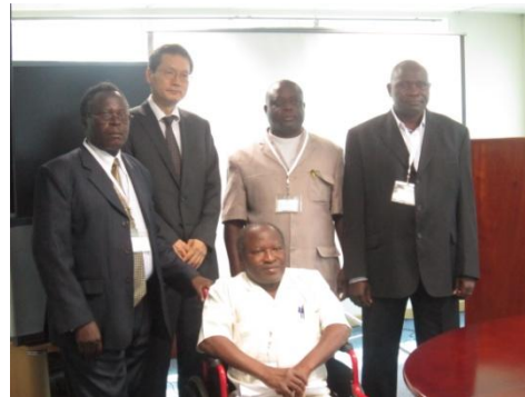
記念写真 Commemorative photo