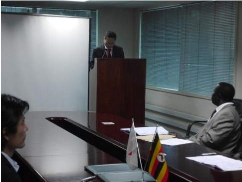
本使によるスピーチ