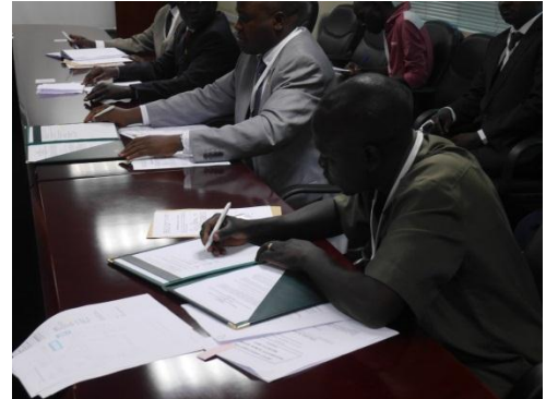
G/Cを署名する被供与団体代表