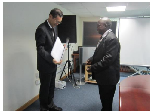
アミザル・ジェロム校長(アジュマニ県ザイピ中高等 学校における理科実験棟建設計画)と本使