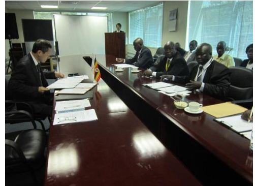
G/Cに署名する本使及び被供与団体代表