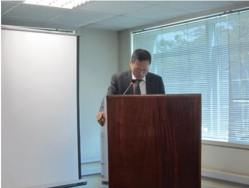
本使によるスピーチ